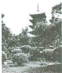
Five-storey pagoda of Tō-ji

Tō-ji (东寺) is a Buddhist temple of the Shingon sect in Kyoto, Japan . Its name means East Temple, and it once had a partner, Sai-ji (West Temple). They stood alongside the Rashomon, the gate to the Heian capital. It is formally known as Kyō-ō-gokoku-ji (教王护国寺 The Temple for the Defense of the Nation by Means of the King of Doctrines ) which indicates that it previously functioned as a temple providing protection for the nation. Tō-ji is located in Minami-ku near the intersection of miya Street and Kujō Street, southwest of Kyoto Station .