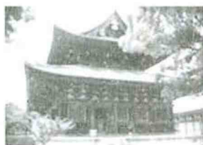
Ancient Building at Tō-ji

Tō-ji is often associated with Kōbō Daishi (Kūkai). The well-known Buddhist priest was put in charge of Tō-ji in 823 by order of Emperor Saga . The temple's principal image is of Yakushi Nyorai, the Medicine Buddha.