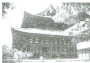
Ancient Building at Tō-ji

Tō-ji is often associated with Kōbō Daishi (Kūkai). The well-known Buddhist priest was put in charge of Tō-ji in 823 by order of Emperor Saga . The temple's principal image is of Yakushi Nyorai , the Medicine Buddha.