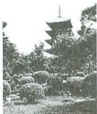
Five-storey pagoda of Tō-ji

Tō-ji (东寺) is a Buddhist temple of the Shingon sect in Kyoto, Japan . Its name means East Temple, and it once had a partner, Sai-ji (West Temple). They stood alongside the Rashomon , the gate to the Heian capital. It is formally known as Kyō-ō-gokoku-ji (教王护国寺 The Temple for the Defense of the Nation by Means of the King of Doctrines ) which indicates that it previously functioned as a temple providing protection for the nation. Tō-ji is located in Minami-ku near the intersection of miya Street and Kujō Street, southwest of Kyoto Station .